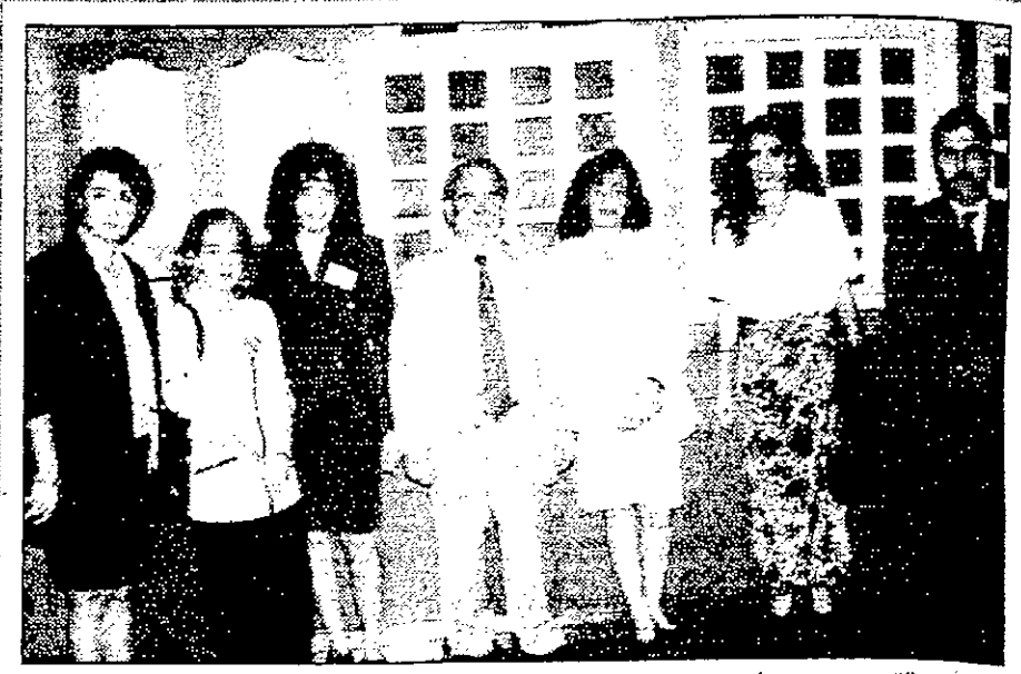
التقريب القبرصي مع مضاعف وجهه نسائية